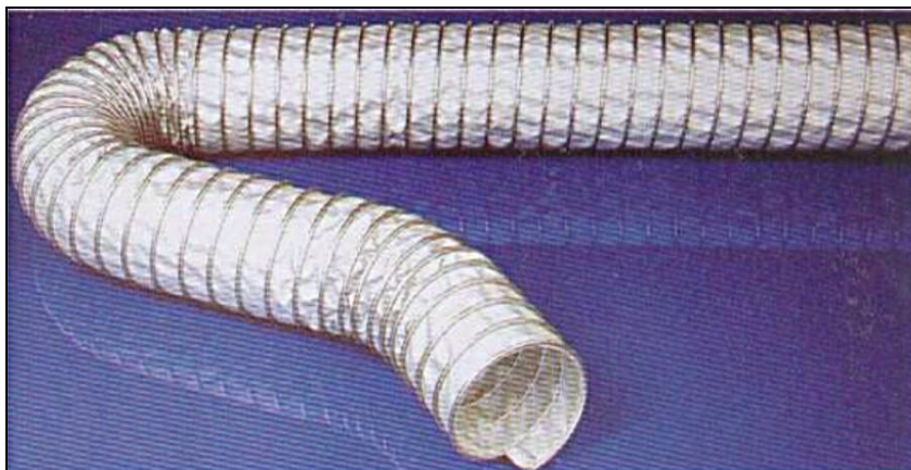
Type Master-Clip HT 650 toiles résistantes à la très haute température, renforcé en acier spiralé

Pour toutes applications nécessitant une résistance à la température