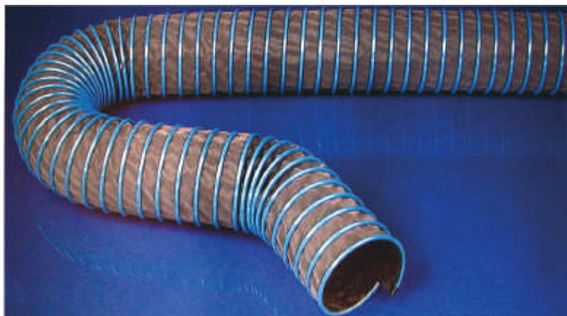
Type CARFLEX 200 fibres de polyester, renforcé en acier galvanisé spiralé et revêtu de plastique.