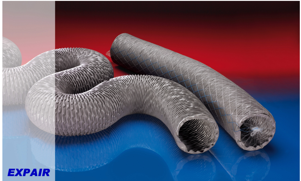
Type ST/MP en acier avec spire et toile revêtu renforcé.

Ultra léger, ultra souple Difficilement inflammables, bonne résistance aux bases et acide, et aux produits chimiques. Bonne résistance mécanique. Comprimable 10 fois sa longueur.