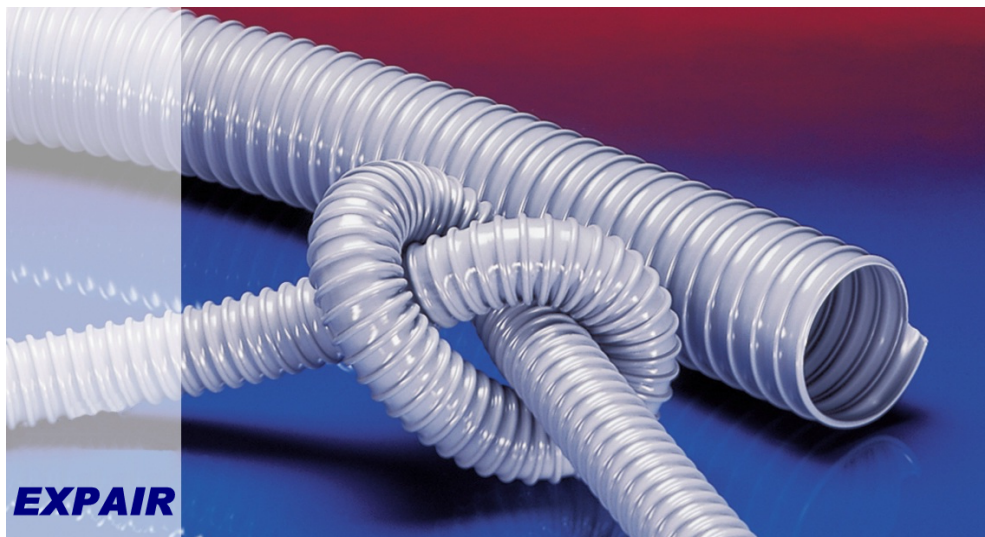
Type G-PCV en PVC spiralé renforcé, anti-écrasement, résistante aux vibrations, paroi intérieure très lisse.

Pour l'extraction de diverses poussières ou particules peu abrasives.